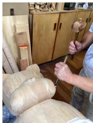
匠の手がのらくろに魂を吹き込みます。