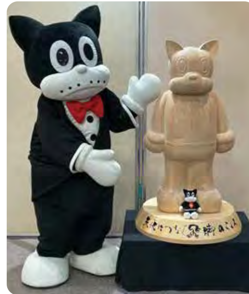
飛脚のらくろには、森下文化センター1階で会えます。