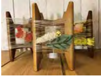
大きさ 縦横約10cm x 高さ約17cm

深川シルク(※)や綿、和紙などの素材を木枠に巻き付け、オリジナルの行灯を作ります。 ※ワイルドシルクミュージアムが深川で飼育(養蚕)している蚕の繭からとれたシルク糸です。 所要約2時間。